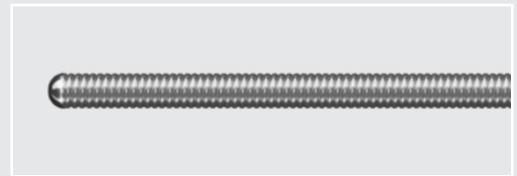
40 cm プラチナ製チップ ナイチノールワイヤ