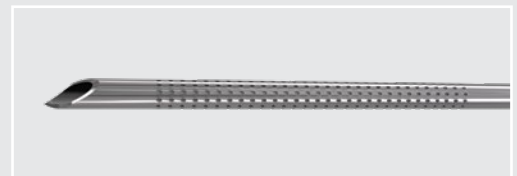
21G、7 cm EchoTip® ニードル